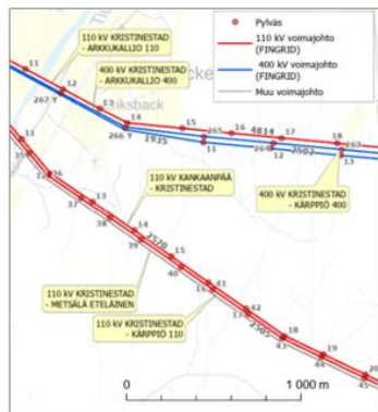
Kuva 1: Fingridin voimajohdot kartalla.