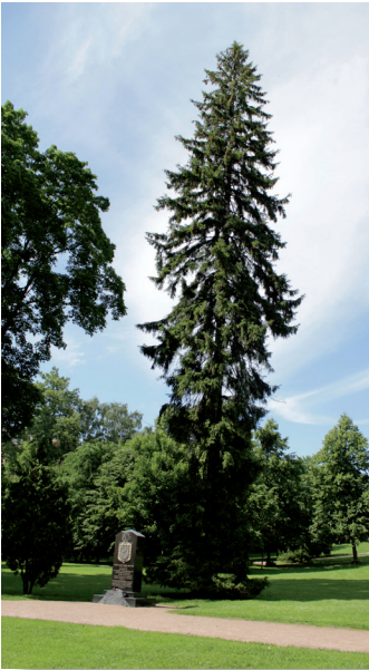
Helsingin Kaivopuistossa kasvaa 1917 kylvetty Itsenäisyyden kuusi.

Kampanja on osa Suomi 100 -ohjelmaa ja sen suojelijana on Tasavallan Presidentti Sauli Niinistö.